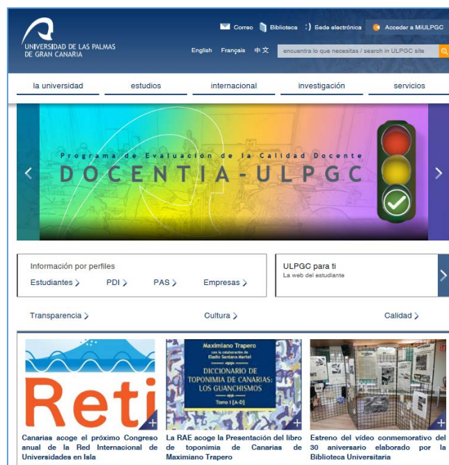
Imagen 1: web institucional, anuncio convocatoria DOCENTIA-ULPGC 2017/18