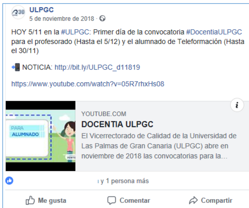
Imagen 2: difusión en las redes sociales del Programa DOCENTIA-ULPGC